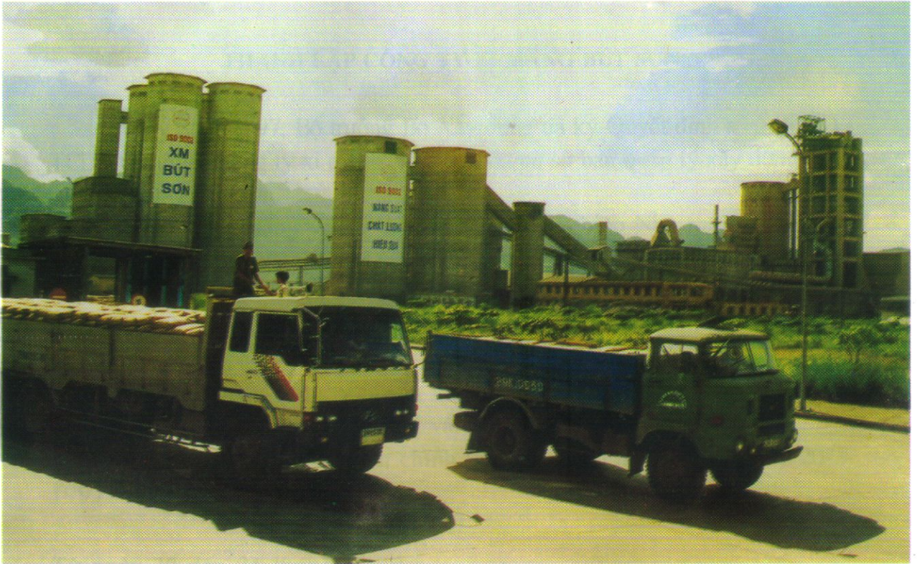
Sản phẩm dây chuyền I Công ty xi măng Bút Sơn.