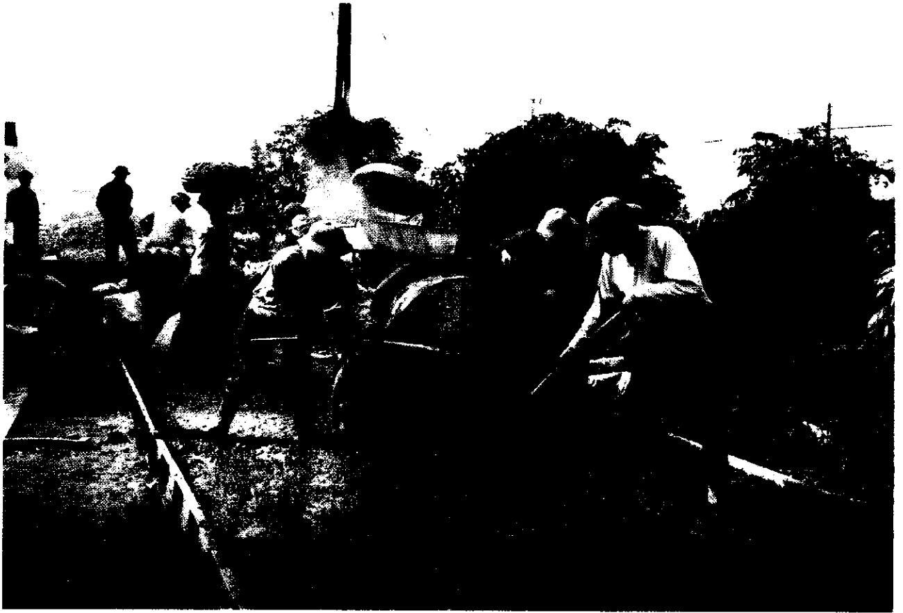
Phong trào làm đường giao thông nông thôn của huyện Thanh Liêm.