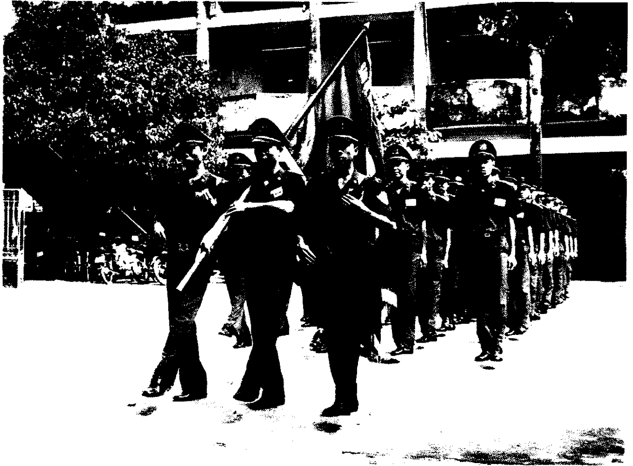
Lực lượng CAND Hà Nam rèn luyện xây dựng đơn vị chính quy hiện đại.